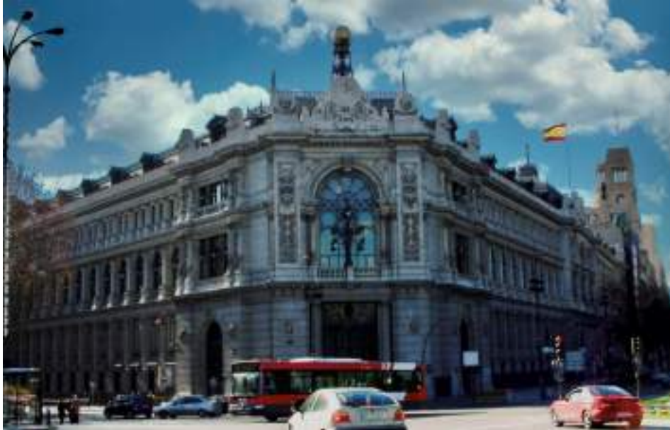
Fig. 23: Banco de España

La edad mínima para trabajar en España es de 16 años . Las personas pueden ser clasificadas como: