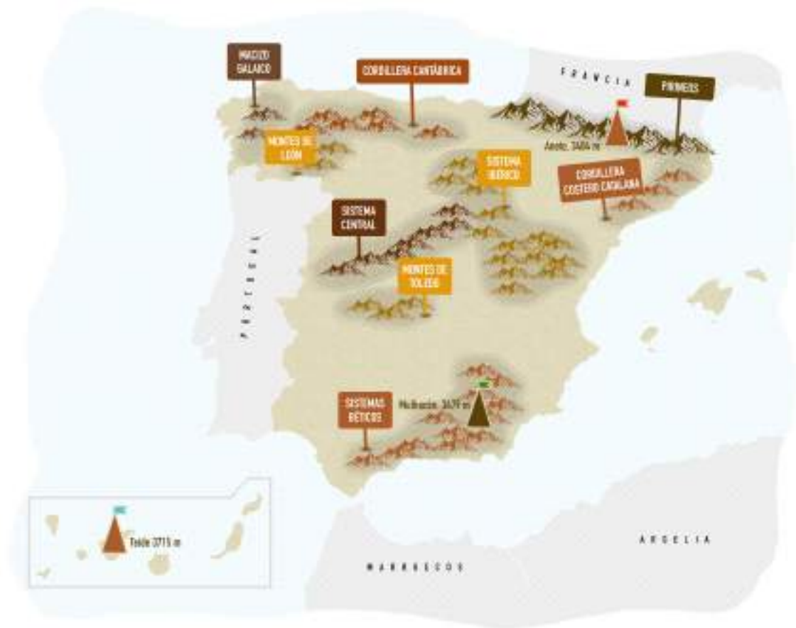
Fig. 9: Sistemas montañosos y picos más importantes

España fue uno de los primeros países de Europa en comenzar a proteger la naturaleza; la primera Ley de Parques Nacionales se aprobó en 1916. Tiene 16 parques nacionales; su gestión y protección se hace a través de la Red de Parques Nacionales.