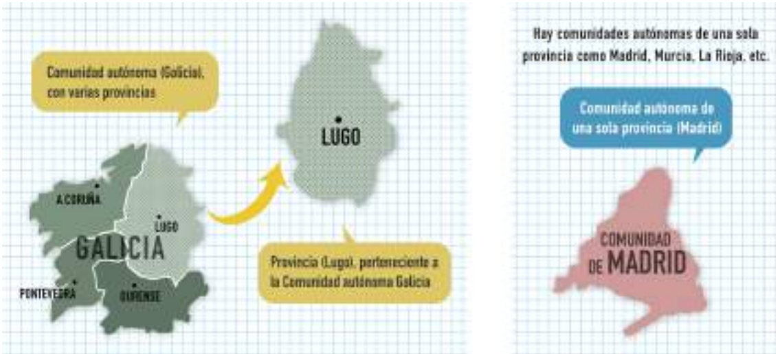
Fig. 6: Comunidades autónomas y provincias

El representante del Estado en una comunidad autónoma es el delegado del Gobierno.