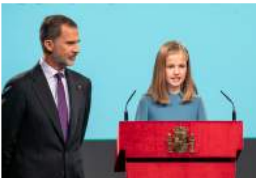
Fig. 2: Felipe VI, rey de España y Leonor de Borbón, princesa de Asturias

La capital de España es Madrid desde mediados del siglo XVI, antes lo fueron Valladolid y Toledo.