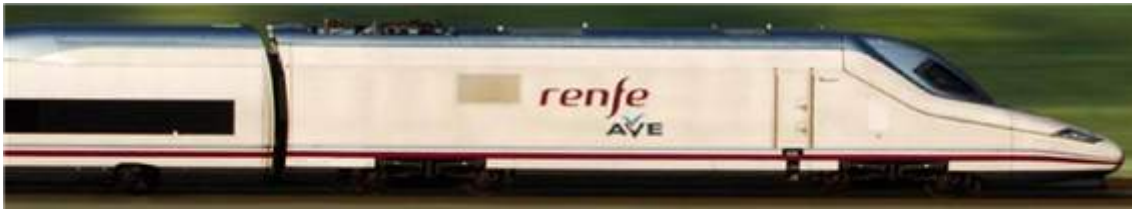
Fig. 22: AVE, tren de alta velocidad española