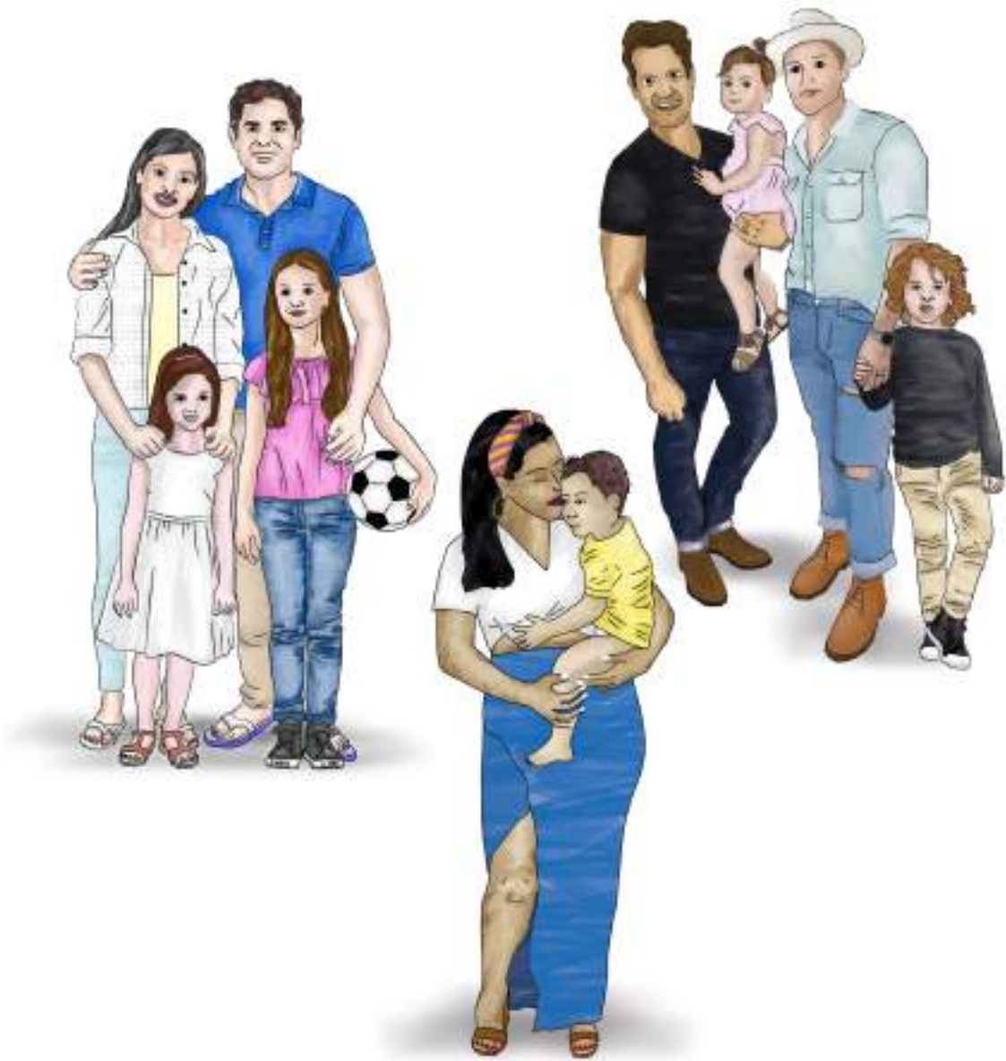
Fig. 16: Familias

Entre los diferentes tipos de familia que existen en España están las familias monoparentales (hijos al cuidado solo de la madre o del padre). Son familias numerosas las que tienen tres hijos o más.