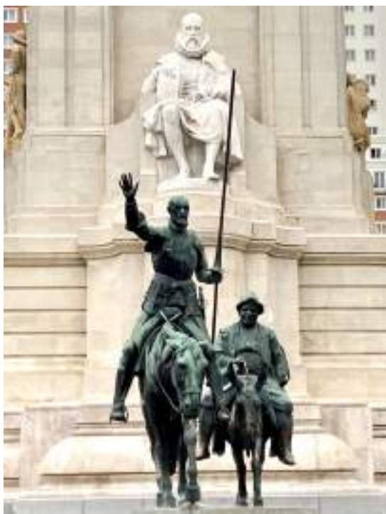
Fig. 11: Don Quijote y Sancho Panza

España posee una larga tradición literaria. Muchos autores y obras son reconocidos internacionalmente.