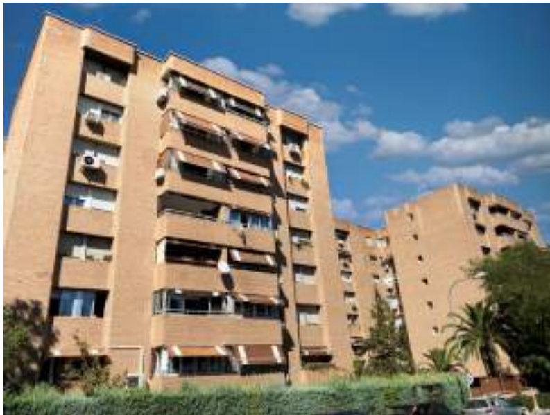
Fig. 17: Bloque de viviendas

Según las últimas estadísticas, un 75 % de las viviendas en España son en propiedad (en el 30% de los casos, el propietario paga una hipoteca o préstamo bancario para comprarla). Por otro lado, el porcentaje de españoles que alquilan la vivienda se acerca al 25 %.