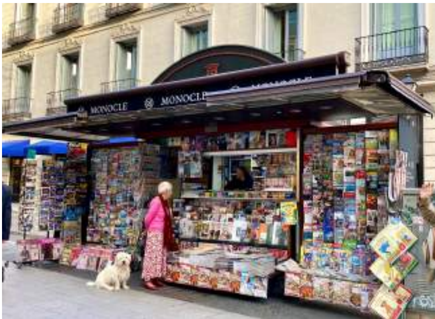
Fig. 21: Quiosco