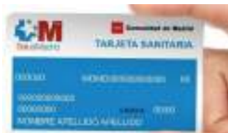
Fig. 15: Tarjeta sanitaria