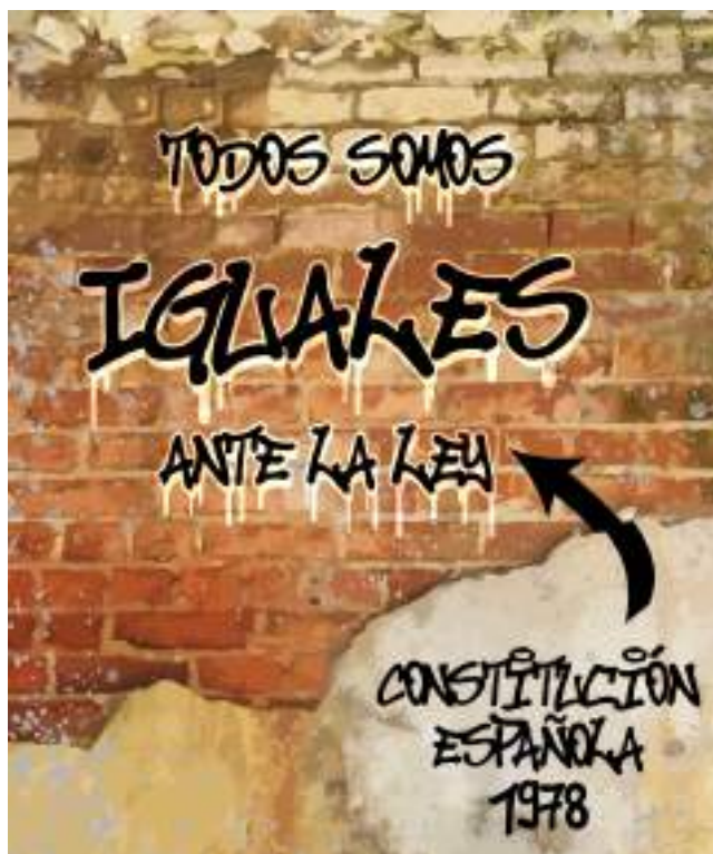
Fig. 7: La Constitución española

En la Constitución de 1978 se recogen los derechos fundamentales, deberes y libertades de los españoles, dentro y fuera de España, y de los residentes extranjeros.