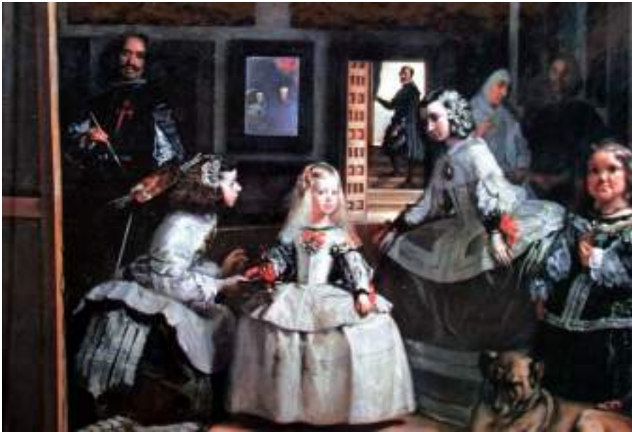
Fig. 12: Las meninas , de Velázquez

España tiene un rico patrimonio. La Unesco ha reconocido 49 bienes españoles como Patrimonio de la Humanidad (bienes culturales, naturales y mixtos), lo que sitúa a España como el tercer país con más bienes reconocidos, por detrás de Italia (58) y China (56).