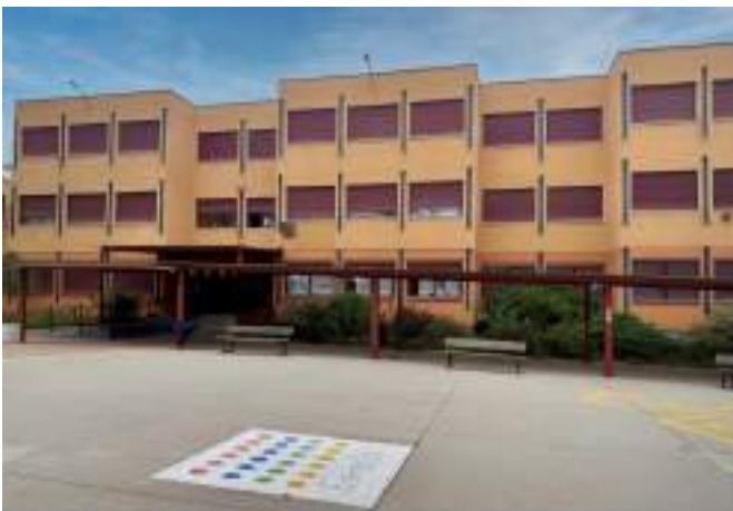
Fig. 19: Colegio de educación primaria

La educación es un derecho de los ciudadanos; es obligatoria y gratuita (excepto libros y materiales educativos) desde los 6 hasta los 16 años, lo que se llama educación básica .