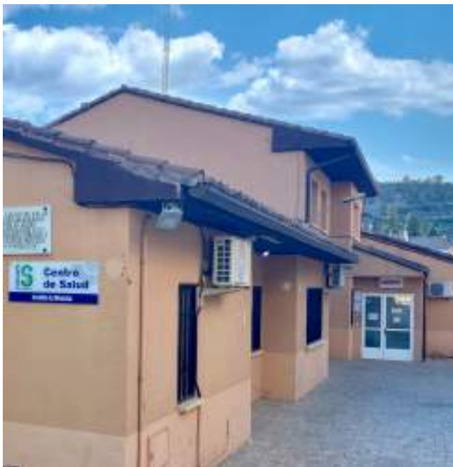
Fig. 20: Centro de salud

El Sistema Nacional de Salud es el conjunto de servicios sanitarios ofrecidos por los poderes públicos de España. Las competencias de sanidad son de la Administración Central, a través del Ministerio de Sanidad y de las comunidades autónomas. El Ministerio de Sanidad propone y ejecuta la política del Gobierno en materia de salud, de planificación y asistencia sanitaria para asegurar a los ciudadanos el derecho a la protección de la salud.