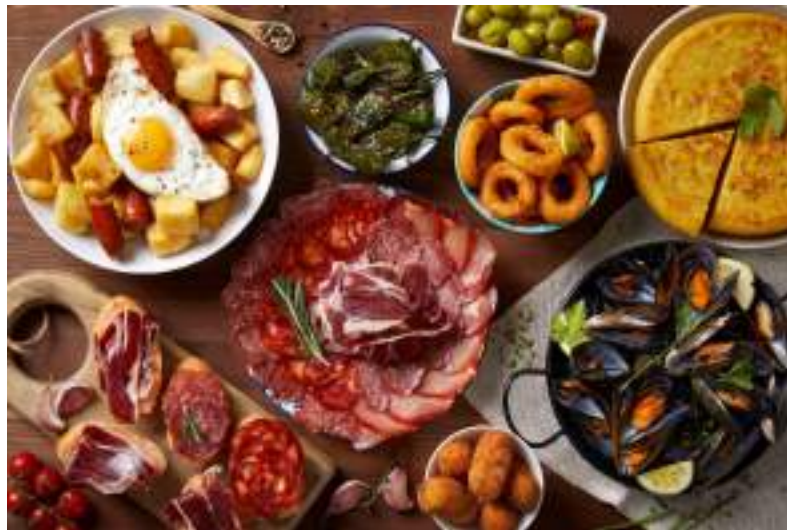
Fig. 18: Barra de bar con pinchos y tapas

Las regiones más conocidas por sus denominaciones de origen (D. O.) son: La Rioja, Ribera del Duero y Jerez, para los vinos; Principado de Asturias, para la sidra; Cataluña, para los cavas; Andalucía y Castilla-La Mancha, para el aceite de oliva; Extremadura, Andalucía y Castilla y León, para los productos ibéricos.