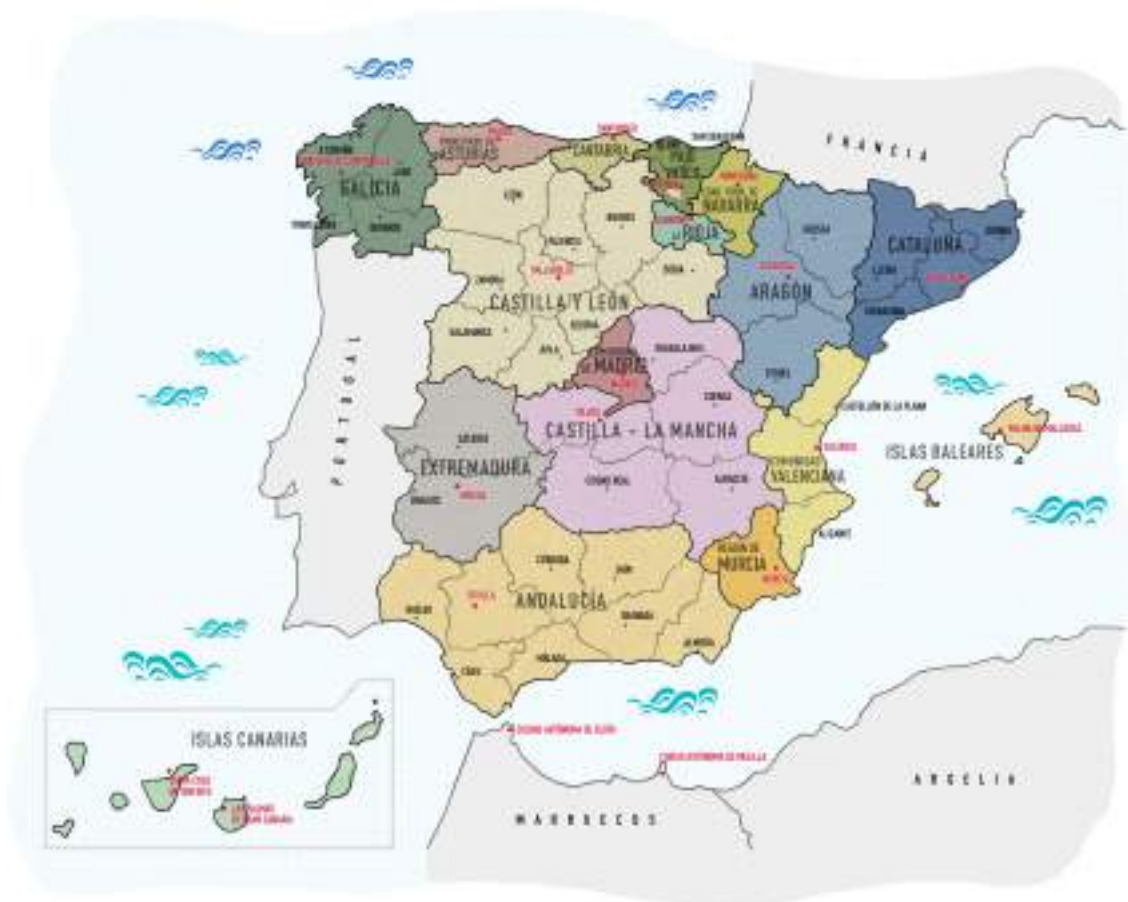
Fig. 10: Mapa político de España

En el mapa político de España, se puede observar la división de España en comunidades y ciudades autónomas.