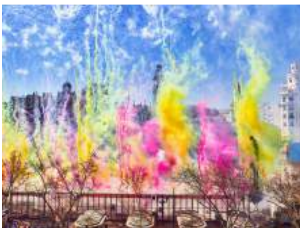
Fig. 13: Masclatà. Fallas de Valencia