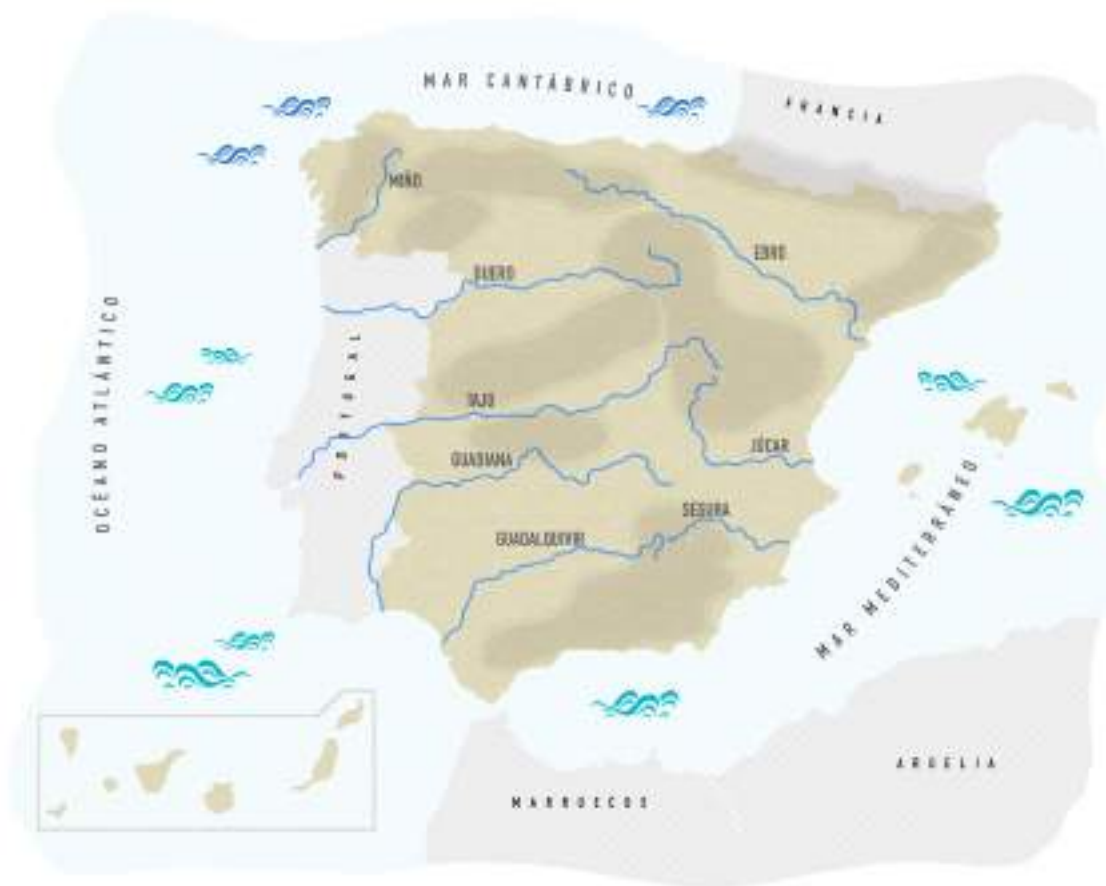
Fig. 8: Mapa de ríos y mares de España