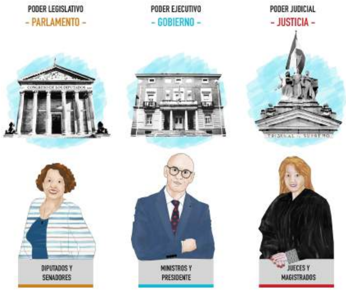
Fig. 4: Los tres poderes

En la Constitución se establece la separación de los poderes ejecutivo, legislativo y judicial , lo que garantiza el funcionamiento de las instituciones españolas.