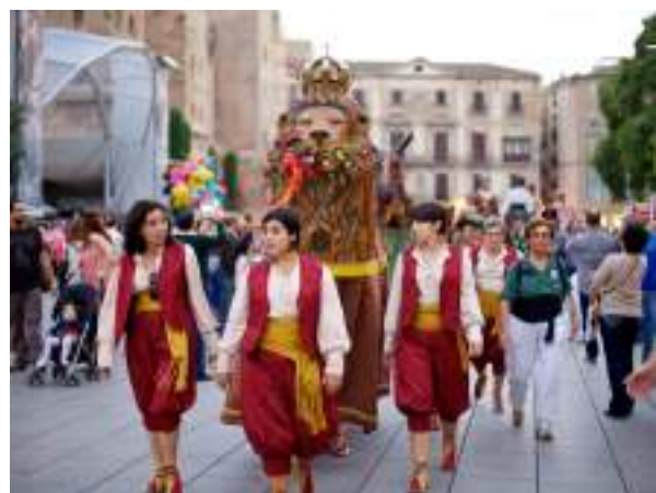
Fig. 13 bis: Desfile de gigantes. Fiestas de la Mercè. Barcelona.