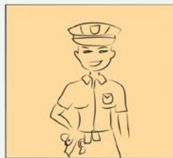
Garda de seguridade