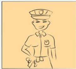
Garda de seguridade