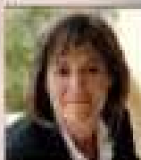
NURIA MARÍN I MARTÍNEZ ALCALDESSA DE LA CIUTAT

Las entidades necesitamos crecer, renovamos, diversificamos y acometer nuevos retos que nos mantengan vivos, gracias a todos los componentes de la Casa Galega por su trabajo. Al ayuntamiento de L'Hospitalet por su apoyo y a la comisión de fiestas por dejarnos iniciar este camino con ellos.